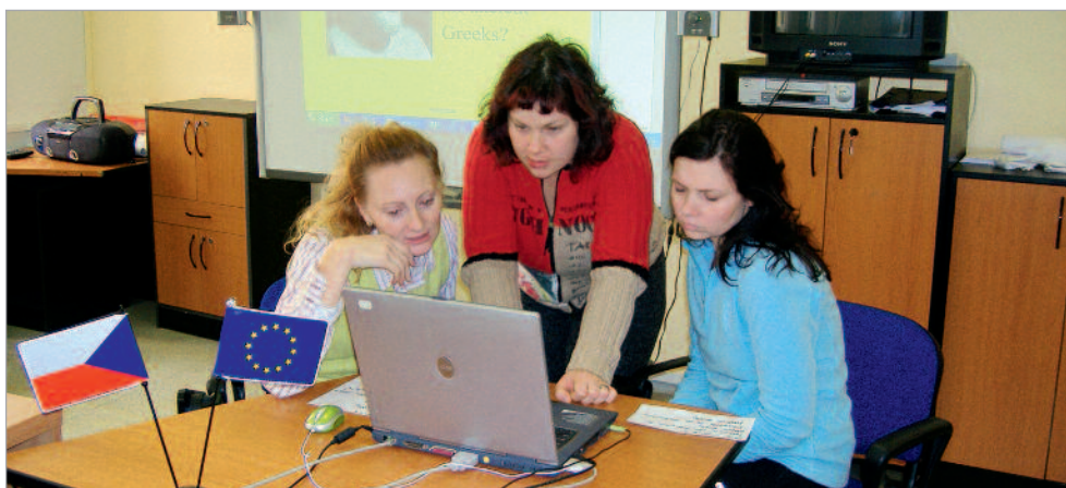
NIDV tradičně podporuje interaktivní formy výuky na školách.