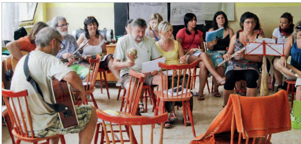
Tradiční letní akce pro učitele Prázdnyňe trochu jinak 2012 pořádané krajským pracovištěm NIDV v Ústí nad Labem.

Celkově bude podpořeno projektem 570 pedagogů, pilotáží učebnice projde cca 1.520 žáků z 86 pilotních tříd ve 13 krajích ČR.