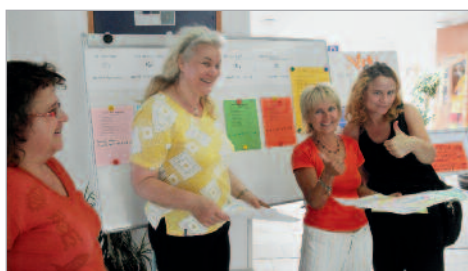
Letní škola čtenářských dovedností 2012 v Jihlavě.

Pro manažery škol a školských zařízení byl určen malý cyklus seminářů zaměřený na rozvoj lidských zdrojů, který uspořádal NIDV, krajské pracoviště Brno ve dnech 20. – 23. srpna 2012 na Richtrových boudách v Peci pod Sněžkou.