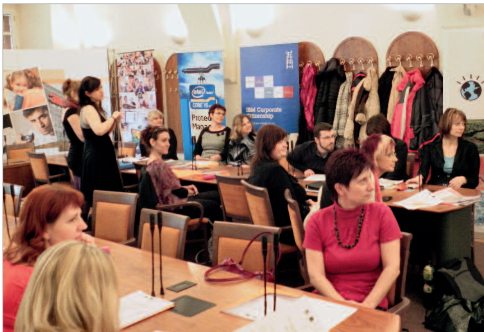
Finálové kolo 1. ročníku celostátní soutěže digitálních výukových objektů DOMINO ČR, které se uskutečnilo na MŠMT. Foto: archiv NIDV

Finálové kolo soutěže – celostátní přehlídka