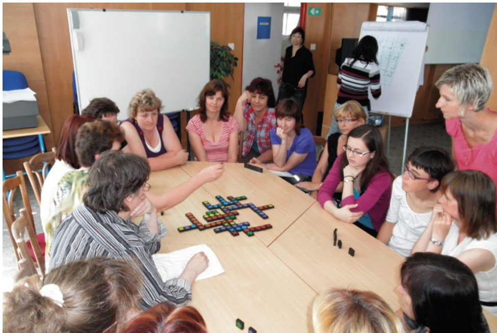
Jihlavské pracoviště NIDV organizovalo v letních měsících seminář Škola matematických dovedností.

votě. Akce se zúčastnilo 32 učitelů, kteří formou pracovních dílen získali množství prakticky použitelných nápadů, návodů a metod do výuky matematiky. Prezentovány byly činnosti motivační, upevňovací, procvičovací a činnosti, které rozvíjejí představivost, zdokonalují paměť a dokážou zaujmout žáky.